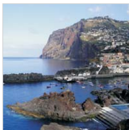
Ilha da Madeira Portugal

ENOTEL BAÍA APARTAMENTOS RESTAURANTES & BARES SERVIÇOS ESPORTE E LAZER