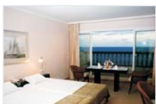
Vista Mar com Varanda

Capacidade máxima: 3 pessoas e um bebê dormindo em berço.