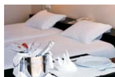
Suíte Vista Igreja

Capacidade máxima: 2 pessoas e um bebê dormindo em berço.