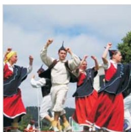
Folclore Típico da Ilha da Madeira