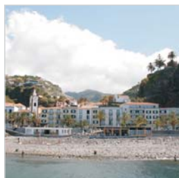
Vista do Hotel

ENOTEL BAÍA APARTAMENTOS RESTAURANTES & BARES SERVIÇOS ESPORTE E LAZER