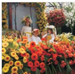
Madeira Ilha das Flores e Contrastes